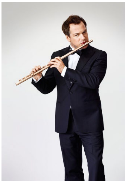
Emmanuel Pahud