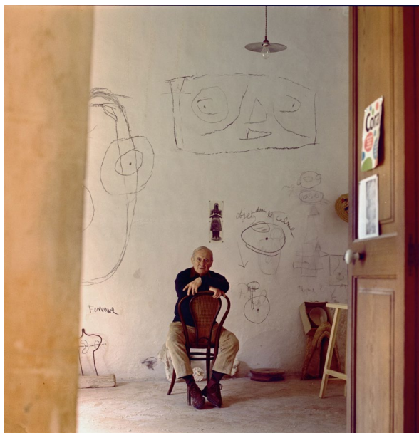
Joan Miró in seinem Atelier Son Boter in Palma de Mallorca, 1968